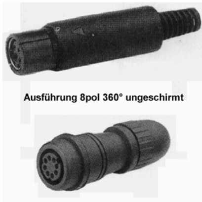
Ausführung 8pol 360° ungeschirmt